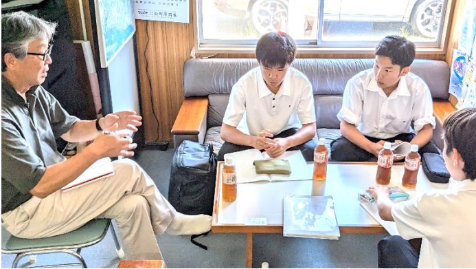
最上川第二漁協で話を聞く K-2 班

本校では1～3年次でそれぞれ探究活動（=MT）を行っており、特に2年次は各班で設定したテーマをもとに一年間にわたって探究活動を行い、1月末に研究発表会を実施するという長い活動となります。