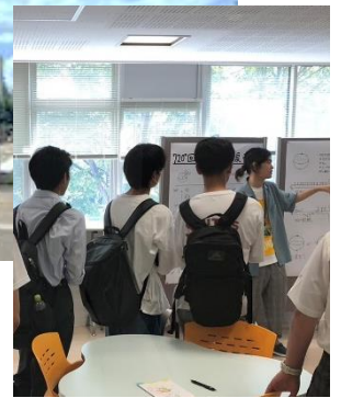
東北大学キャンパスとオープンキャンパスの様子